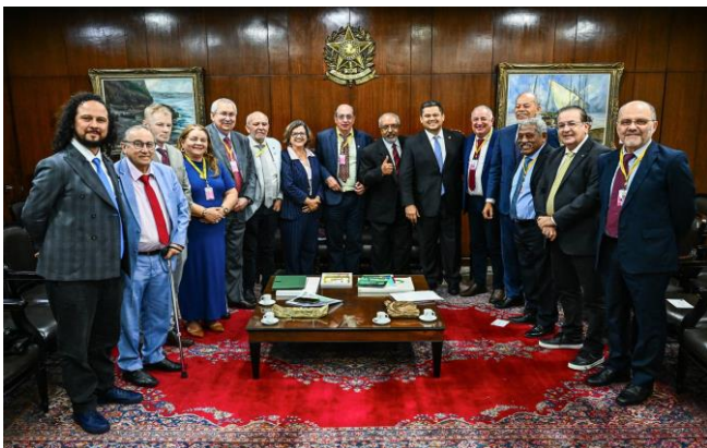
Davi Alcolumbre se encontra com centrais sindicais para discutir a redução da jornada de trabalho com a PEC 221/2019.

O encontro, realizado antes da sessão de debates no Plenário, foi avaliado como positivo pelas lideranças sindicais, que destacaram a disposição do presidente do Senado em dar andamento à proposta.