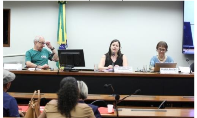
A Comissão de Administração e Serviço Público debateu o assunto

Especialistas ouvidos pela Comissão de Administração e Serviço Público da Câmara dos Deputados defenderam a criação do Sistema Nacional de Saúde do Trabalhador e da Trabalhadora (Sinast). O objetivo do sistema será integrar dados e políticas públicas para enfrentar mortes e adoecimentos evitáveis no trabalho.