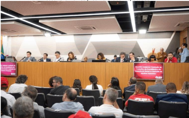
Deputados e ministros fizeram debate em Belo Horizonte (MG)