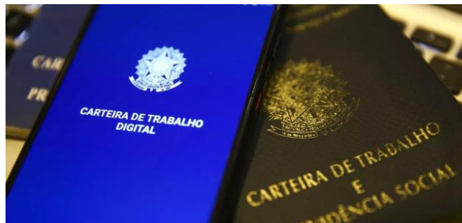
Carteira de trabalho digital

Dados do Ministério do Trabalho mostram que 73,7% dos empregados com carteira assinada trabalham mais de 41 horas por semana no Brasil