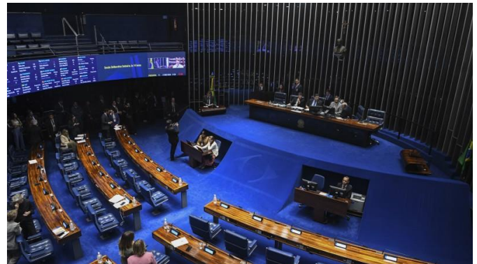
Proposta aguarda despacho desde 28 de maio.

Discussão terá como objetivo avaliar os impactos sociais, econômicos e produtivos da redução da jornada de trabalho